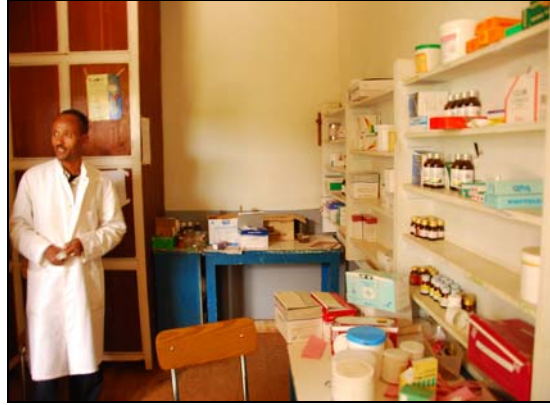
Farmacia de la clínica de Addo