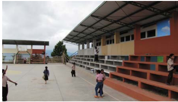
Escuela Santa Teresa Resultado final