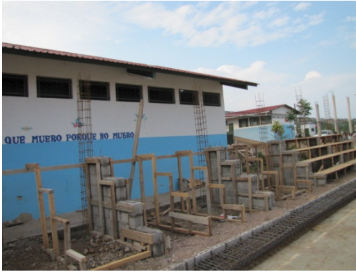
Escuela Santa Teresa Situación inicial