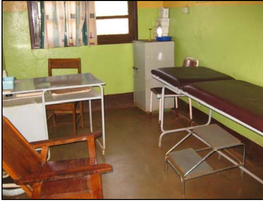
Sala de consulta en Konchi